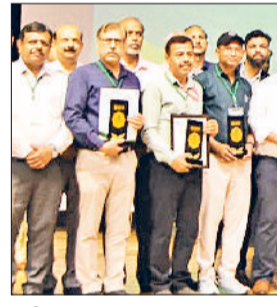
पानीपत। हरियाणा विधानसभा के अध्यक्ष हरविंदर सिंह कल्याण के साथ सम्मानित हुए नागरिक।