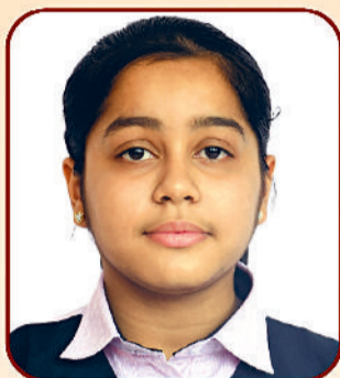
AARCHI 98.4 %