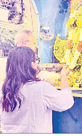
पानीपत। हरिनाम संकीर्तन में प्रभु का पूजन करते हुए श्रद्धालु।

पूजन किया। इससे पूरा वातावरण हरिनाम संकीर्तन की मधुर ध्वनि से भक्तिमय हो उठा। इस पावन अवसर पर इस्कोन प्रचार समिति पानीपत के द्वारा कटारिया लैंड पर अगले सप्ताह आयोजित होने वाली श्रीमद् भागवत कथा के लिए न्यौता दिया गया।