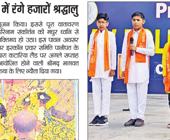
पानीपत। डीएवी पीपी स्कूल में महात्मा हंसराज की याद में भजन सुनाते हुए विद्यार्थी।