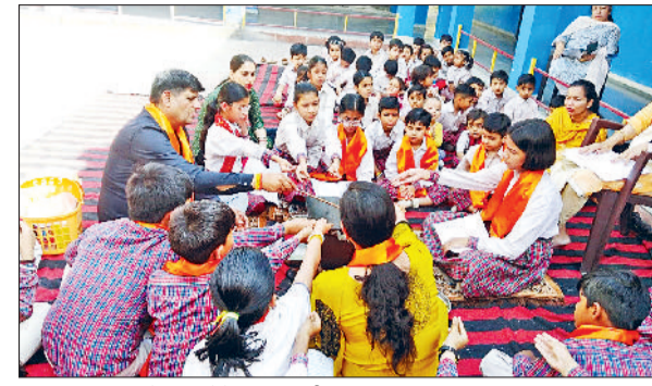
करनाल। हवन में भाग लेते हुए विद्यार्थी।