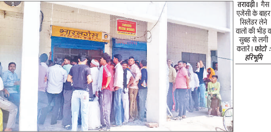
लौटा दिया जाता है कि सिलेंडर खत्म हो गए हैं, कल आना। इस स्थिति से उपभोक्ताओं में भारी रोष देखने को मिल रहा है। गैस उपभोक्ताओं का कहना है कि एक

तरावड़ी शहर में इन दिनों रसोई गैस सिलेंडर को लेकर भारी किल्लत का माहौल बना हुआ है। हालात ऐसे हैं कि उपभोक्ताओं को गैस सिलेंडर लेने के लिए सुबह तड़के 5 बजे से ही गैस एजेंसी के बाहर लाइन में लगाना पड़ रहा है, लेकिन इसके बावजूद भी उन्हें समय पर सिलेंडर नहीं मिल पा रहा। स्थानीय लोगों के अनुसार कोई सुबह 5 बजे और कोई 6 बजे आकर लाइन में खड़ा हो जाता है, फिर भी दोपहर 1 बजे तक नंबर आने पर एजेंसी द्वारा यह कहकर